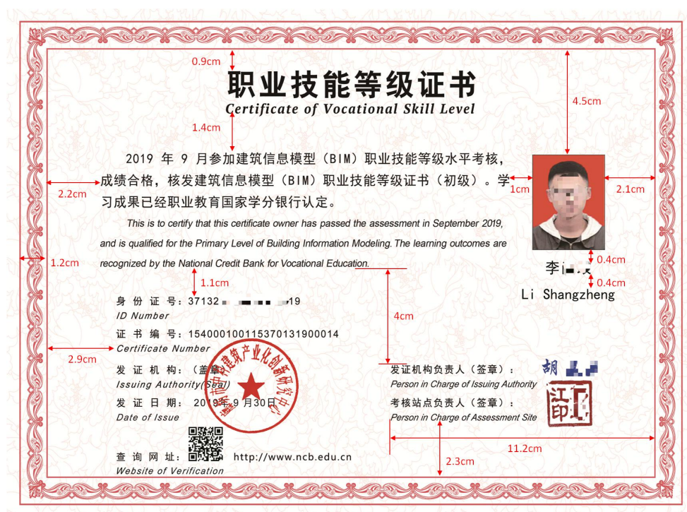
图 1 证书正面